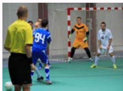
趣味 フットサル・スポーツ 観戦・ビリヤード