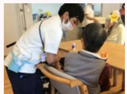
体は小さいですが頑張ります