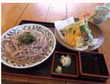
好きな食べ物 そば