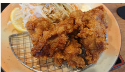
好きな食べ物は唐揚げ