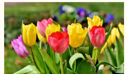
ご利用者様に快適に過ごしていただけるよう頑張ります!!