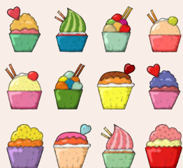
好きな食べ物 お菓子