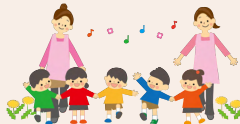
施設職員の子どもたちと楽しく 過ごしています