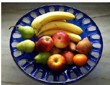
好きな食べ物 くだもの