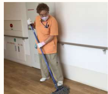
たのしく仕事しましょう